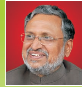
श्री सुशील कुमार मोदी माननीय उपमुख्यमंत्री, पर्यावरण एवं वन विभाग, बिहार